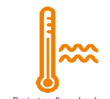
Production d'eau chaude